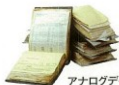
アナログデータ等